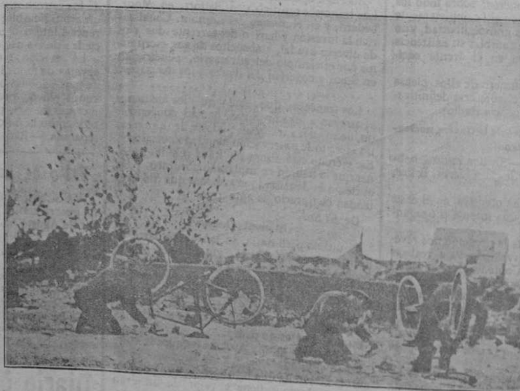
Ciclistas reparando sus máquinas bajo el fuego enemigo.

EL HAVRE 25.—El rey Alberto ha recibido del mariscal Sir Douglas Haig el telegrama siguiente: «Tengo el honor de ofrecer a vuestra Majestad y a nuestros bravos aliados belgas el saludo sincero de las fuerzas británicas de Francia y de Bélgica con motivo de las fiestas de Pascua y Año Nuevo.