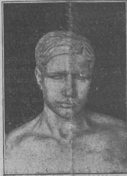
EL BUSTO DEL CAPITÁN LAPORTILLA

El contralmirante Madden manda la escuadra de cruceros.