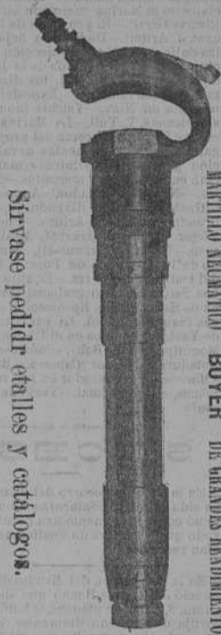
Sirvase pedir catálogos y precios.

Gran Vía, 29.— BILBAO Instalaciones de labrar metales por medio del AIRE COMPRIMIDO. Última palabra en la mecánica moderna. Indispensable para Talleres mecánicos, Astilleros, Diques, etc.