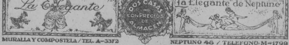
MURALLA Y COMPOSTELA / TEL. A-3372 NEPTUNO 46 / TELEFONO. M-4799

no, tenemos para todas las edades. También en gorritos y zapatos de estambre, tenemos varios estilos.