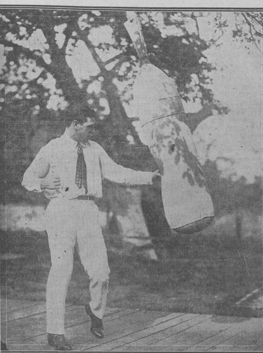
Mickey Walker golpea siempre muy duro el enorme saco de arena (Sand Bag) como en esta ocasión que muestra el grabado, llevar a las manos completamente desahadas, Walker, que es el campeón del mundo del peso welter, se prepara para su próximo encuentro con Harry Greb, y aunque está con pantalones de franela blanca no pierde la oportunidad de hacer training.