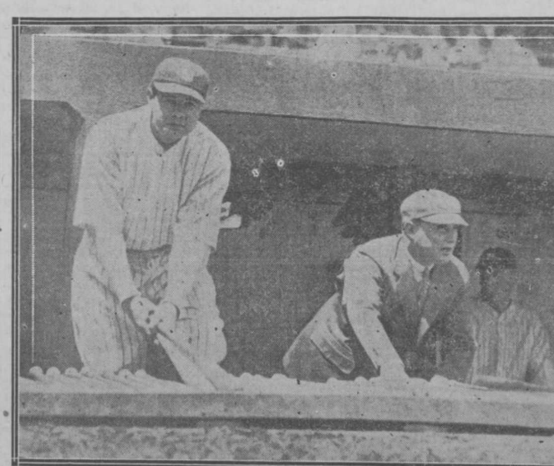
Aquí está en Bambino, un poco débil después de su larga enfermedad, seleccionando el bate con el que espera dar el home run, como lo hizo ayer al pitcher Miller, del Cleveland, el primero que produce después de su reaparición en el juego.