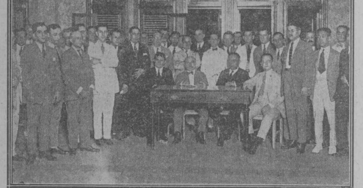
Los comerciantes de las calles de Galiano y San Rafael, reunidos en "El Encanto" para tratar de los festejos presidenciales