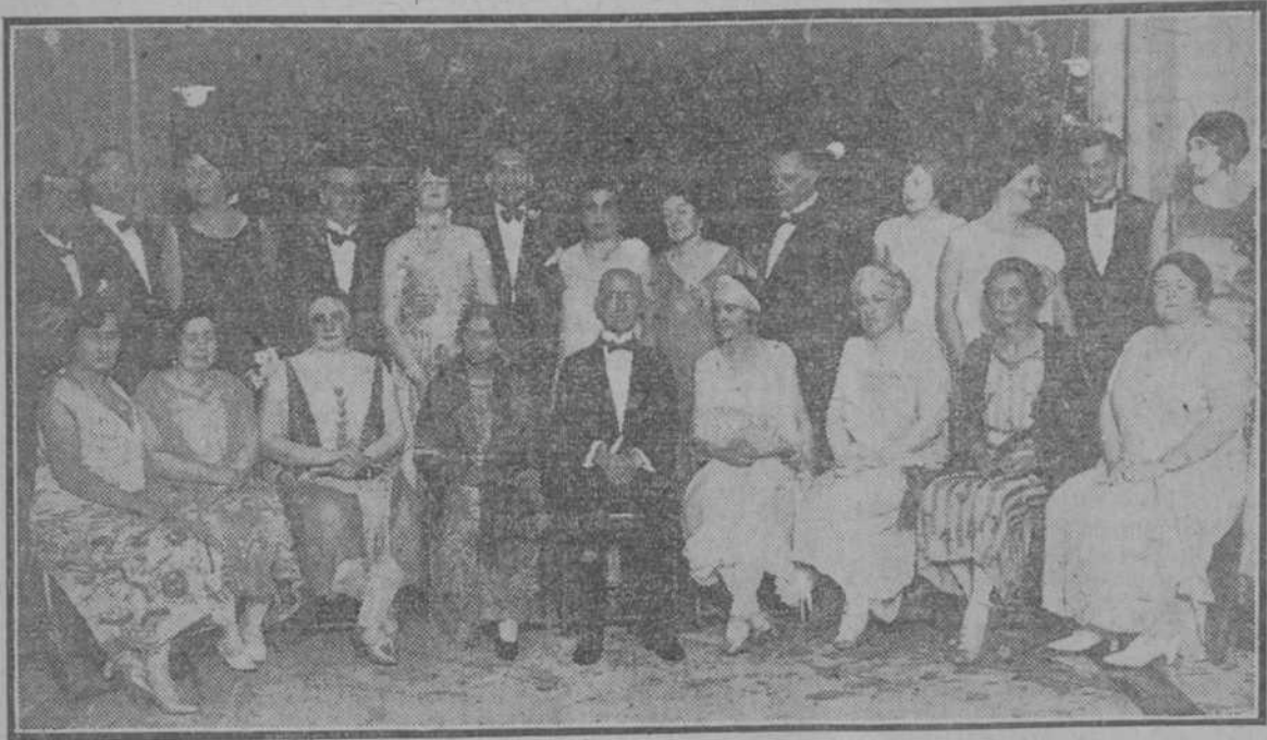
El General Crowder, con un grupo de concurrentes a la fiesta

De paso por la Habana. Villa, de gran notoriedad por sus fotografías en Méjico, ha venido a esta capital para seguir viaje a Nueva York. Entre otras ladies de las que componen el Comité Ejecutivo del