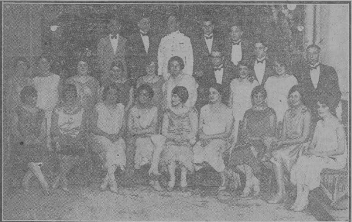
Otro aspecto de la concurrencia