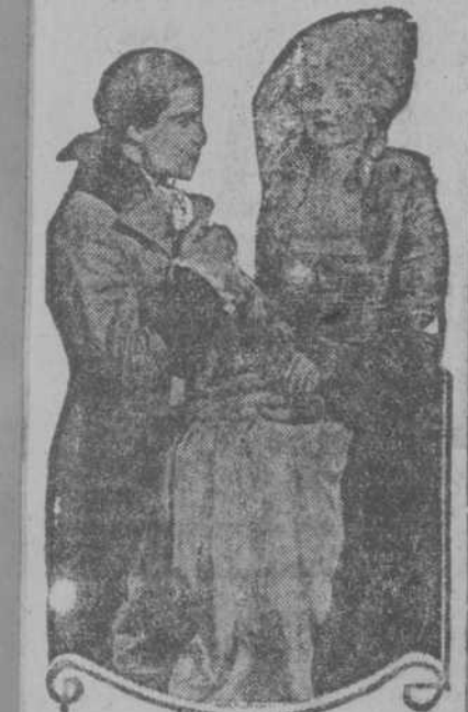
RAMON NOVARRO and ALICE TERRY in "SCARAMOUCHE"

¡Si todas las cintas que se hicieran fueran como "Scaramouche"! Pero este realmente es una tontería hasta pensar; no se puede concebir que todas las películas tengan los mismos méritos. "Scaramouche" es una excepción dentro de la regla de que casi todas las producciones son corrientes y no se salen de lo vulgar.