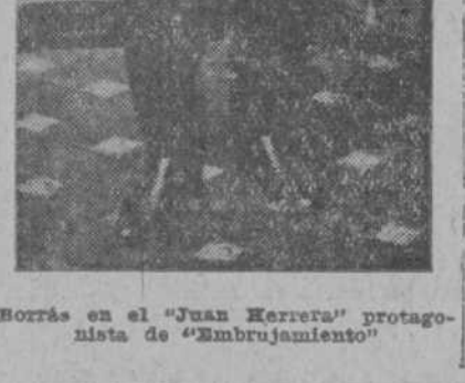
Borrás en el "Juan Herrera" protagonista de "Embujamiento"

Mañana por la tarde, "El Cardenal" función especial pedida por las familias. Última representación de esa obra durante la actual temporada.