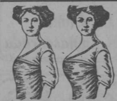
ANTES DE TOMAR LAS PILDORAS DESPUES