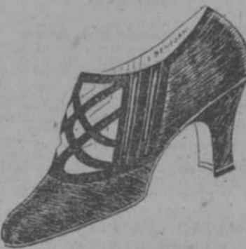
MODELO SE LUJO 843

De charol, $5.99, de raso negro $6.50. Como este tenemos muchos modelos de todos los colores y pieles desde $1.99 hasta $6.50.