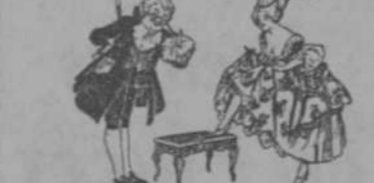
"BAZAR INGLÉS" S. RAFAEL e INDUSTRIA HABANA-CUBA