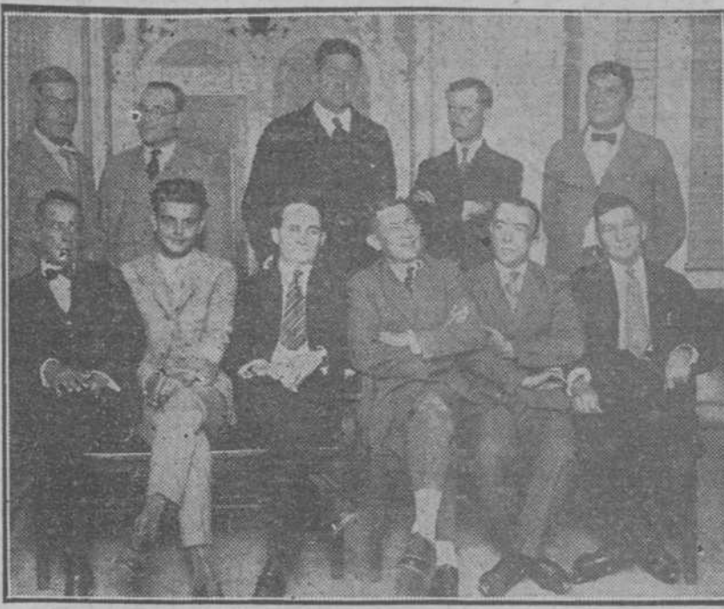
Comisión de la Asociación de Colonos de Camaguey

Los emigrantes canarios desembarcan libremente en Cuba. El festival de los cronistas en el Teatro Nacional. La elocuente memoria del Casino Español. La Unión Vasco Española celebrará una gran velada en el Centro Castellano.