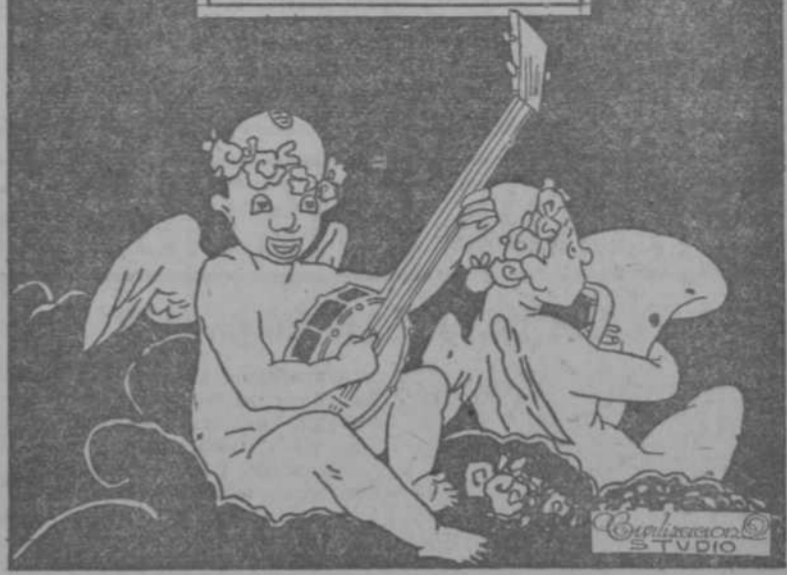
VEASE LA PAGINA NUEVE

LE CONVIENE LEER LA PLANA QUE PUBLICAMOS EN OTRO LUGAR DE ESTE PERIODICO Y DESPUES VISITAR "LA CASA GRANDE"