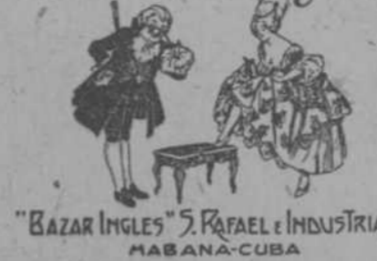
"BAZAR INGLÉS" S. RAFAEL e INDUSTRIA HABANA-CUBA