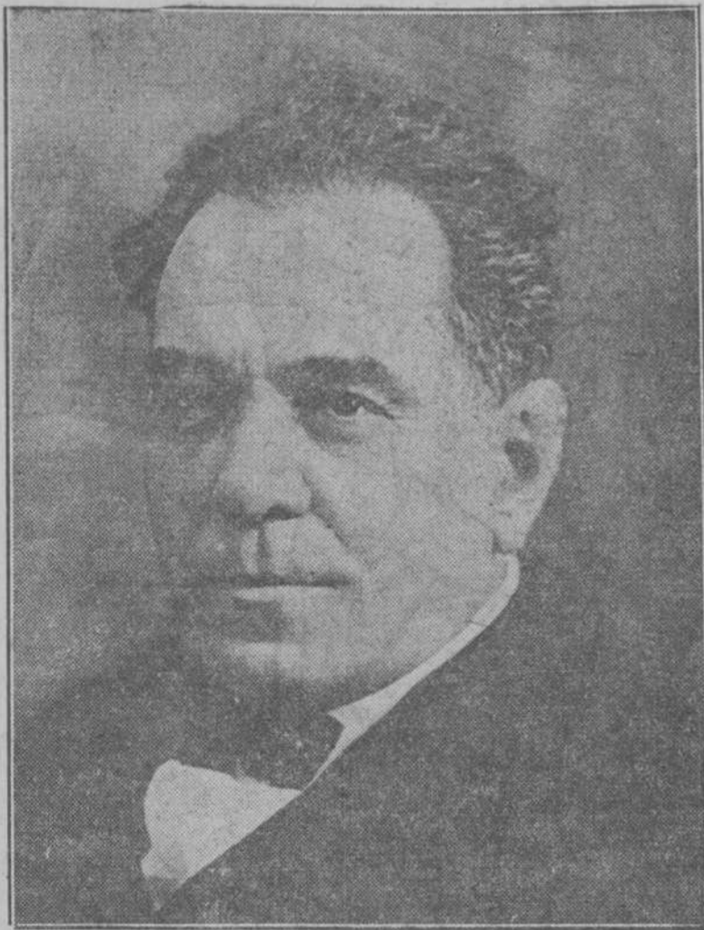
EL MAESTRO VIVES