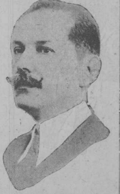
Dr. Cosme de la Torriente