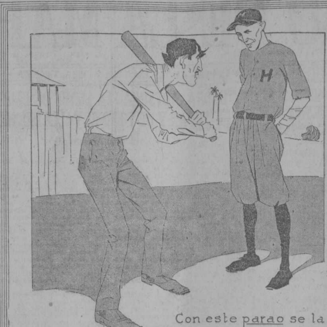
Con este parao se la desenforras a Luque.