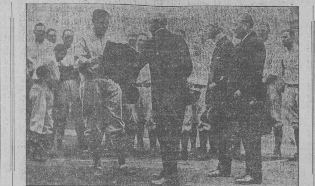
Babe Ruth recibiendo de manos de I. E. Sanborn el certificado de "player más útil a su club" en las ligas mayores, el día de ser izado el pennat de los Yankees en su Stadium.