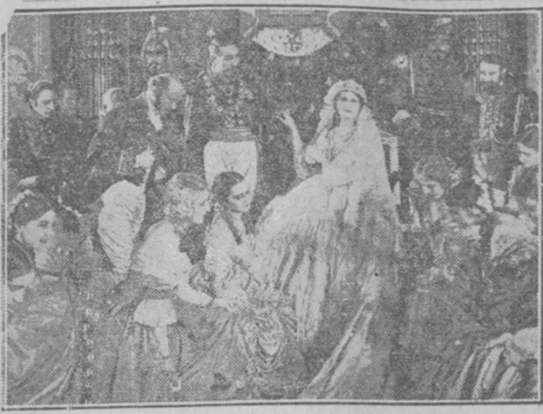
NOCHE de ARTE, de ELEGANCIA y de GALA SOCIAL las NOCHES de RAQUEL MELLER.

No se habla de otra cosa en la Habana.—El estreno de la película de Raquel Meller es la preocupación de todas las familias. Santos y Artigas presentarán con gran realce esta película.