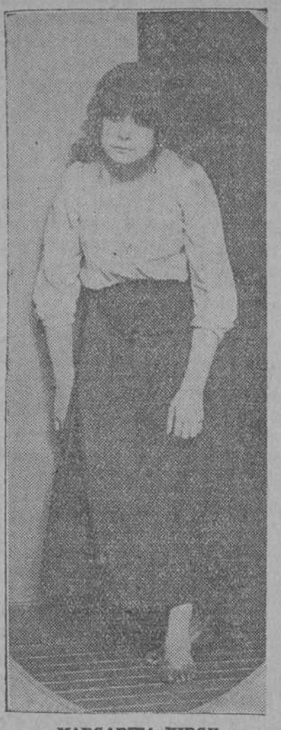
MARGARITA XIRGU, la ilustre actriz española, que celebrará esta noche su "serata d'onore"