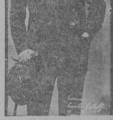
Conm. Carlo Galeffi, el gran barítono italiano, que hará esta noche el Scarpia de la “Tosca” en el Teatro “Nacional”

Esta noche en función extraordinaria a precios populares se cantará la “Tosca” en el teatro “Nacional”