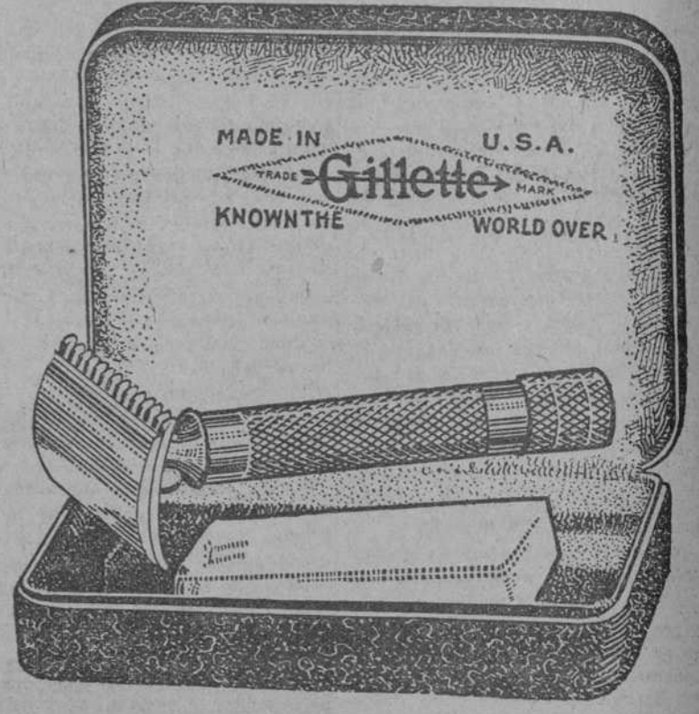
Ilustramos aquí el modelo "United Special." Hay otros dos modelos de Gillette, chapeados de oro, el "Beacon" y el "College," que se venden también a precios populares.

HE aquí su oportunidad de obtener la maravillosa navaja de seguridad Gillette, la cual ha hecho popular el afeitarse diariamente. El juego completo que se muestra arriba, chapeado de oro, con caja de hojas también chapeada, y con estuche forrado de terciopelo, está ahora al alcance de los medios más modestos.