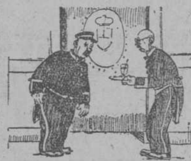
SESIONES PARLAMENTARIAS Parece que aplauden. No; son bofetadas.

que me conozca sabe que jamás desearé de los puestos de honor. Ahora, espero que el Senado evite el atropello que conmigo se quiere hacer; pero si el Senado, con las personas que le constituyen, de tanto relieve y de tanta consideración, no estudian bien los reglamentos interiores, no median y escogen los procedimientos y se me atropella, yo espero que la opinión, y con ella el Gobierno, me harán justicia.