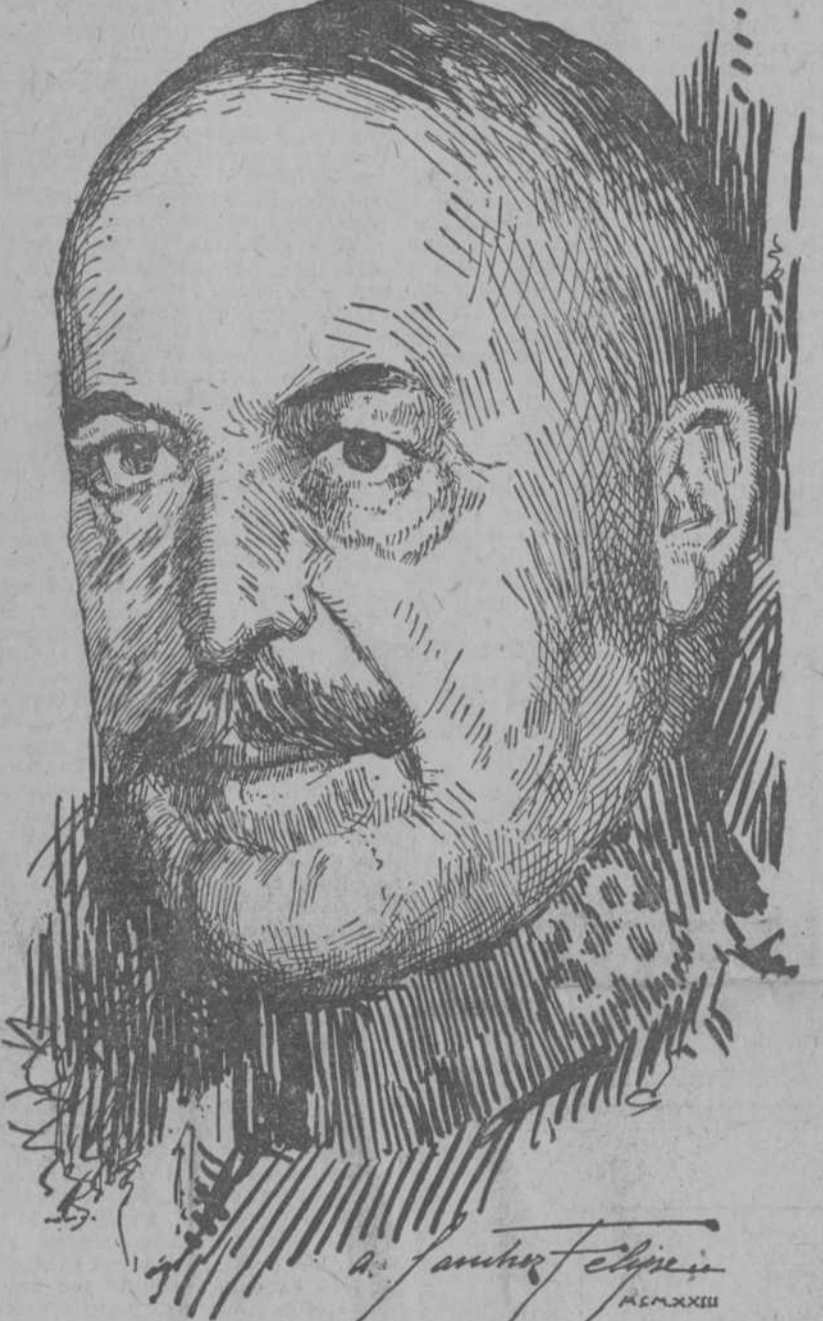
Dibujo a pluma, del natural, expresamente para el DIARIO, por Sánchez Felipe