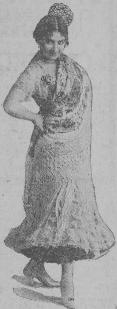
Mme. María Kounezoff, célebre soprano rusa que debutó triunfalmente anoche en el "role" de Margarita.

fo magnífico en el "Dio possente" y en la muerte de Valentín. Es un barítono de belle voz y de óptima escuela de canto. Fuere Ludikar dió al Mefistófeles el verdadero carácter. En los duos con el tenor, en "Le vesu d'or", en la escena de las espadas, su fenetre", en las escenas de la Iglesia y en la Serenata demostró que es un cantante de buenos medios vocales y un artista de mérito positivo. Alta Kinova cantó muy loablemente la parte de Siebel. En "Le parlate d' amor", en el cuarteto y en "Quando a te liola" estuvo acertadísima. Tortorici y Alice Homer se condujeron plausiblemente. Los coros merecen alabanzas. La orquesta, dirigida hábilmente, obtuvo los efectos de la partitura. El Ballet Pavly Oukrainsky presentó superbamente los baillales.