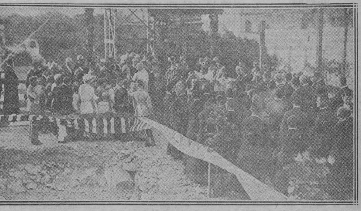
UN ASPECTO DE LA NUMEROSA CONCURRENCIA QUE ASISTIO AL SOLEMNE ACTO

De un trípode adornado con rosas y guirnaldas, y coronado por las banderas cubana y francesa pendía la primera piedra. Llegada la comitiva, el Sr. Obispo bendijo la piedra con el ritual de costumbre.