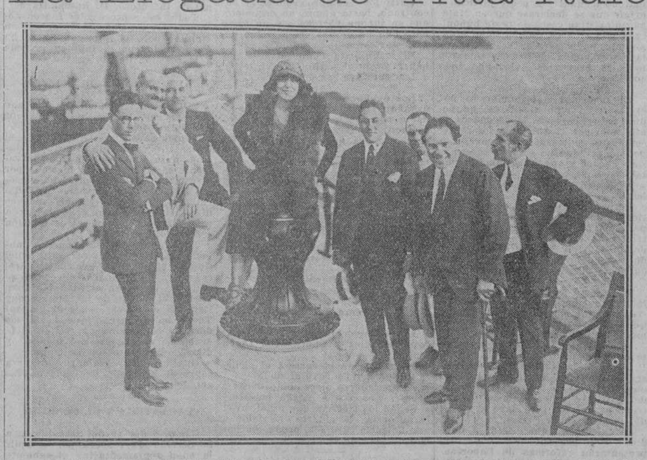
El Com. Titta Rufo, célebre bkar y la soprano Mlle. Yvonne D'Arle, arañito de fama mundial, el bajo Ludl en llegada a la Habana, acompañado ditta Rufo viene a tomar parte en la gran temporada lírica del "Nacional" y bero de Sevilla.