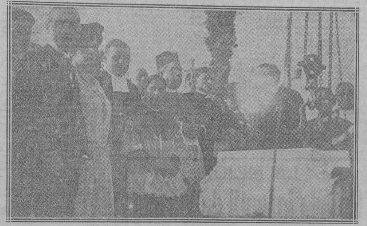
EL ILUSTRISIMO SEÑOR OBISPO EN EL ACTO DE BENDICION DE LA PRIMERA PIEDRA