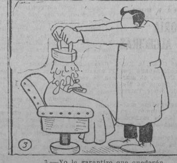
3.—Yo le garantizo que quedarán aplastados.