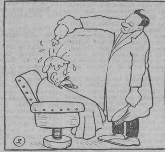
2.—No es verdad, que es un poco fría.