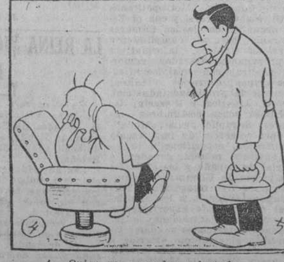
4.—Quien va a quedar aplastado va a ser V. en cuanto me quite esta plasta de los ojos.