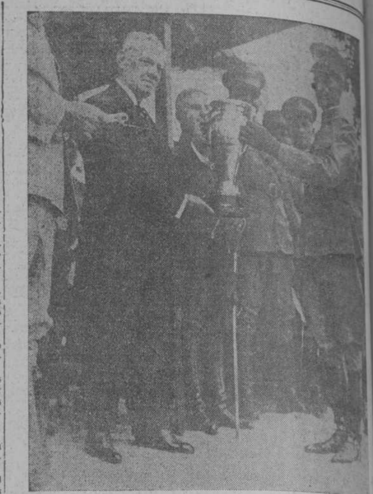
El Sr. Presidente haciendo entrega de la copa que donó, al teniente Ingonieros, que la obtuvo.