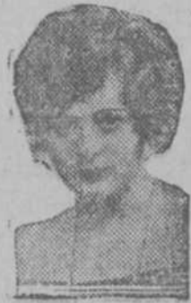
La famosa actriz Bille Love, protagonista de "Juventud triunfadora"