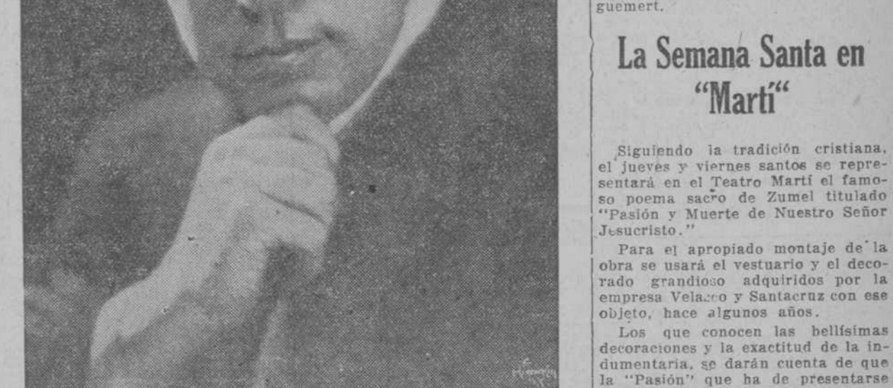
COMM. TITTA RUFFO Considerado como el primer barítono del mundo, que actuará en la Habana con la San Carlo Grand Opera Co.