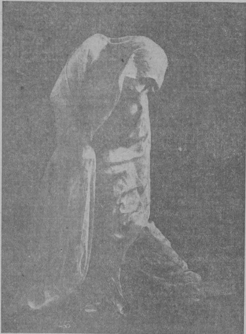
TORTOLA VALENCIA EN "LA MUERTE DE ASE," DE GRIEG.