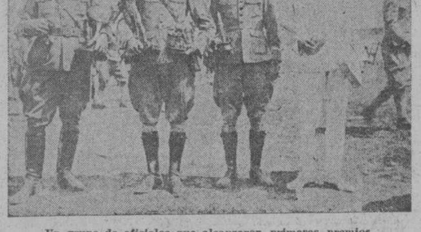
Un grupo de oficiales que alcanzaron primeros premios.