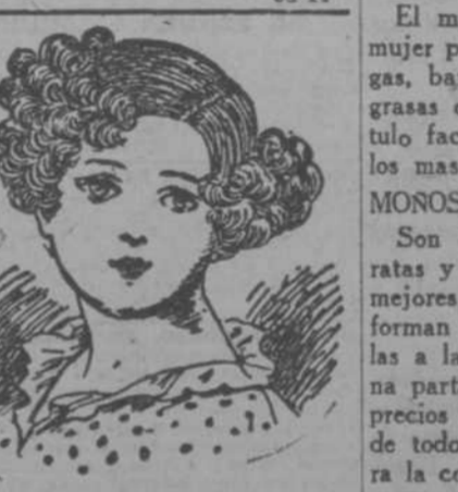
LA PELUQUERIA DE SEÑORAS Y NIÑOS