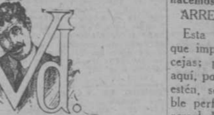
Si tiene canas use la tintura JOSEFINA