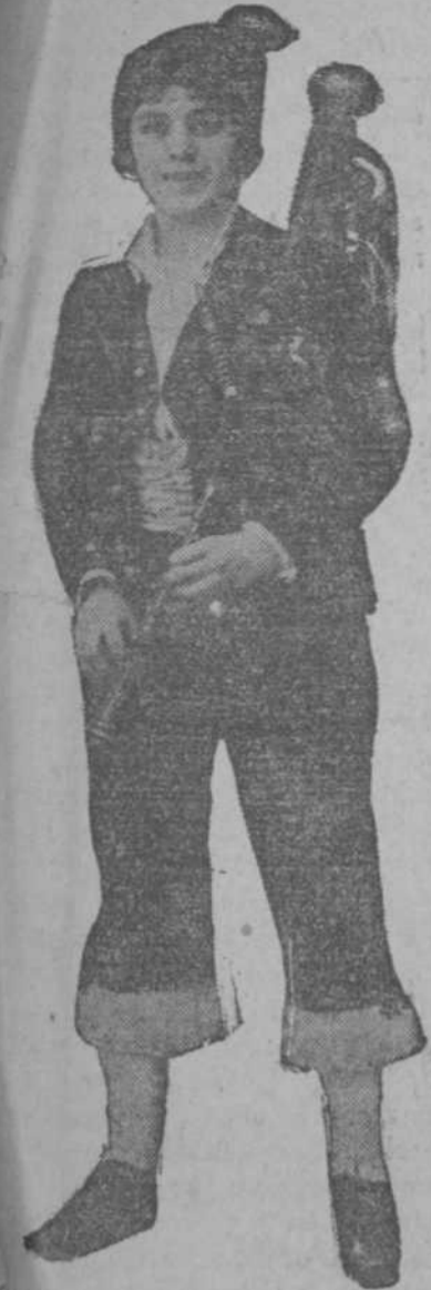
Amalia Molina, famosa tonadillera y bailarina española que celebrará en Capitolio mañana, domingo, su función de despedida.

PRINCIPAL DE LA COMEDIA Matinée elegante a las cuatro y media, con la preciosa comedia en tres actos, de Pedro Muñoz Seca, El Condado de Mairena.