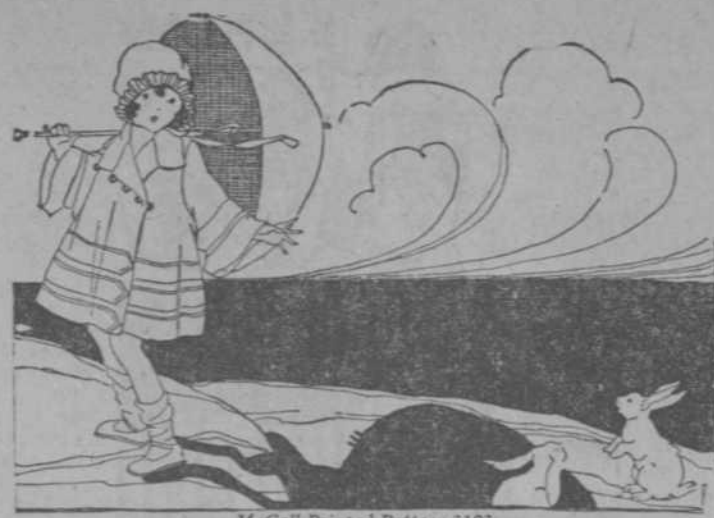
McCall Printed Pattern 3103

che, el nuevo manager del Casino. Comenzó bien. En noche de animación. Eran numerosos los partidos elegantes en las diversas mesas del gran salón.