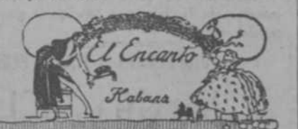
El Encanto Habana

Un lote de vestidos para edades de 12 a 14 años, de crepé de China, tafetán, terciopelo y lana, a $7.00. Un lote de vestidos para las edades de 2 a 14 años, de crepé de China, tafetán, terciopelo y lana, a $8.00.