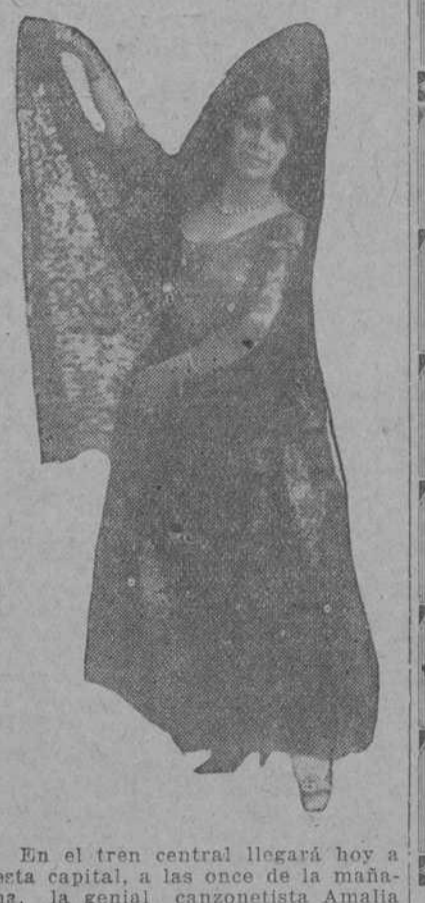
En el tren central llegará hoy a esta capital, a las once de la mañana, la genial canzonetista Amalia Molina...