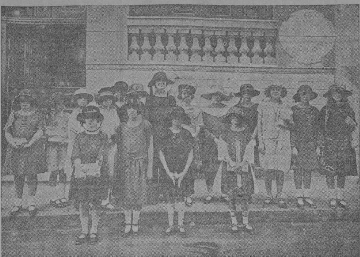
Se agita el simpático grupo de las diáscritas niñas—todas bellas y gentiles—que obtuvieron los premios de nuestro concurso, de los que los chicos entregó el domingo. El acto constituyó una gratísima fiesta infantil, que ya reseñó galanamente el DIARIO DE LA MARINA.