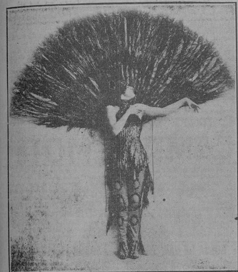
Norka Rouskaya, la célebre violinista y bailarina que debuta hoy en el Capitolio.

Norka Rouskaya, mujer de extraordinaria belleza es a la vez una artista de singular relieve en sus dotes de instrumentista y de danzarina.