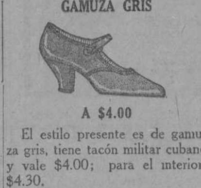
GAMUZA GRIS A $4.00

El presente modelo, es de charol negro, tiene tacón Luis XV. Vale $5.00; para el interior, $3.30. El estilo presente es de gamuza gris, tiene tacón militar cubano y vale $4.00; para el interior, $4.30.