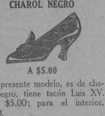
CHAROL NEGRO A $5.00