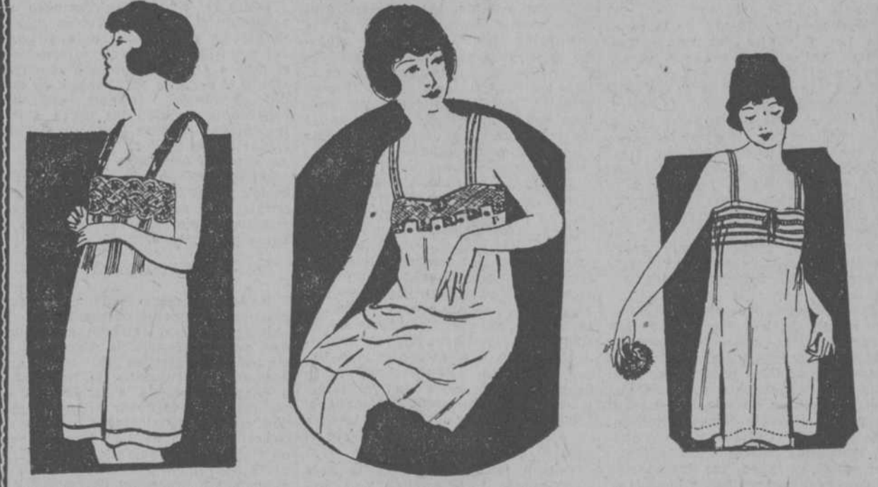
Camisón de lino, superior calidad, bordado en punto turco... Camisón de olán clarín, bordado y hecho a mano adornado con tul... Camisón de lino muy fino, calado y cosido a mano. Muy bonito. Vale $2.90

Confección francesa, a mano, muy elegante y bonita. Diversidad de Modelos en variedad inmensa. DE NANSOUK, de $1.25 a $4.75.—DE HILO DE $3.00 a $9.75