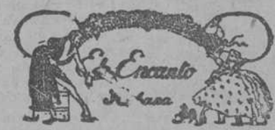
El Rey de los corsés!