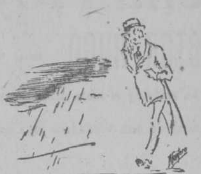
La primavera en Cuba es efíme- ra.

Puede decirse que del invierno pasamos, en transición rápida, al verano.