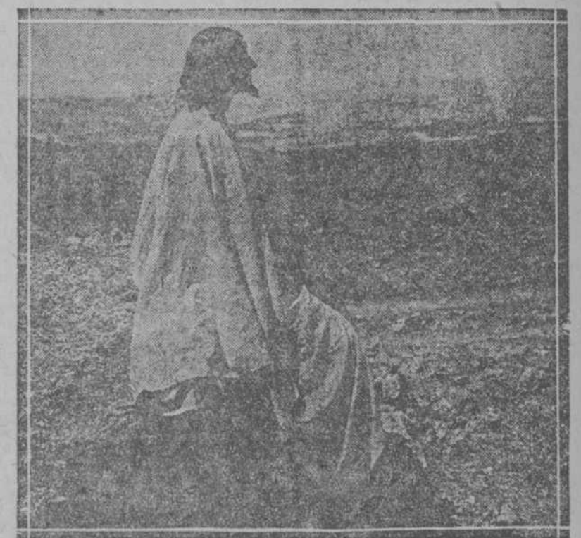
"Cristo en el Monte de los Olivos", es el nombre de la más sensacional película de "Nuevo Testamento" que se está imprimiendo en los Estados Unidos.

—¿Cómo se siente, usted? —De tal modo me siento, que no puedo sentarme. —Pues para sentarse y sentirse bien, use los supositorios Flamel que no tienen rival contra las pesadas almorranas. Desde la primera aplicación alivian. En treinta y seis horas curan radicalmente cualquier grave. —¿Dónde se venden? —En todas las farmacias acreditadas. Y hay depósito de ellos en las droguerías principales Sarrá, Johnson, Tauchel, Majó y Colomer, Barrera y Compañía. A.