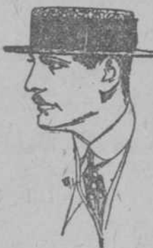
Los Elegantes prefieren nuestros

PAJILLAS porque son los más finos y los mejores y los vendemos a los precios más bajos.