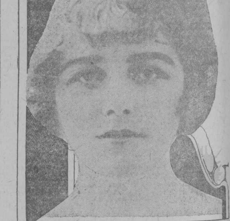
La Condesa de Wilton, de la más rancia aristocracia inglesa, resiste a pasar por el divorcio que la libertaría de los lazos del matrimonio, que tan odioso le ha resultado debido a las aventuras amorosas de su consorte.