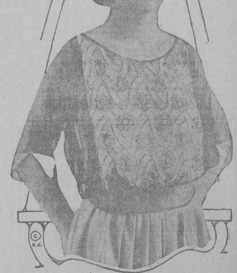
El uso de blusas con bordados de fan tasia, se ha generalizado de tal modo en la Ville Lumiere, que ha pasado el Atlántico, y no es extraño ver una bella neoyorquina luciendo una, por las anchas avenidas de la gran metrópolis americana.