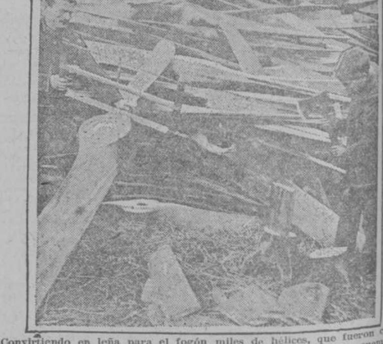
Convirtiendo en leña para el fogón miles de helices, que fueron contruidos para sembrar la muerte y la destrucción en los países enemigos del Imperio