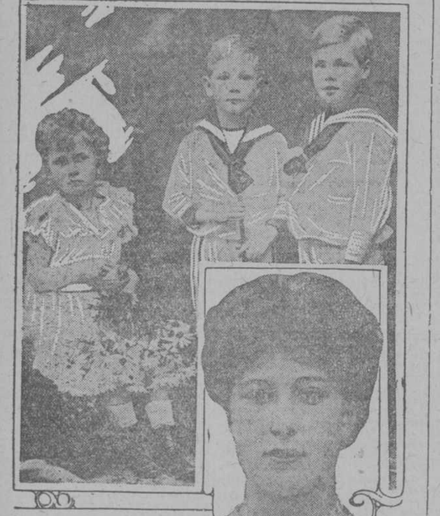
Fotografía de la novia real como aparece hoy en día y como lucía en su niñez. En una fotografía aparece acompañada del Príncipe de Gales y el actual Duque de York, sus hermanos.