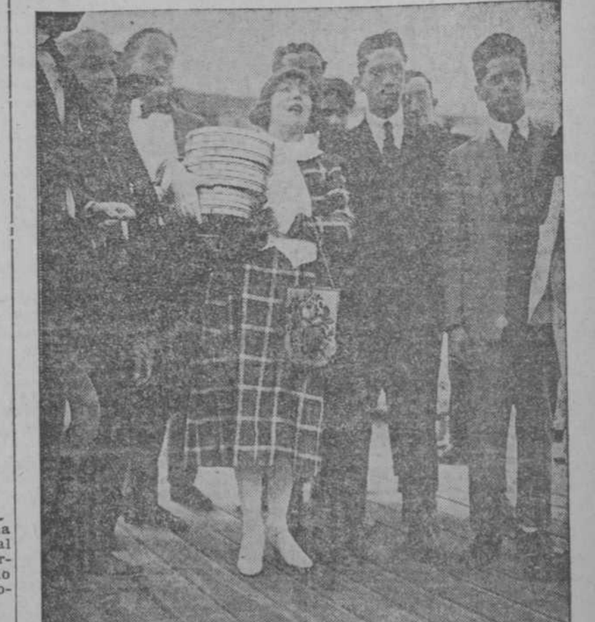
La afamada actriz cinematográfica Mae Murray, al llegar ayer a la Habana

EL DIA 18 SE ESPERA EL PRIMER VAPOR DE LA "MEXICAN PETROLEUM CO." QUE HA EXTENDIDO SUS NEGOCIOS A CUBA. —LOS QUE LLEGARON Y LOS QUE EMBARCARON.—OTRAS NOTICIAS.