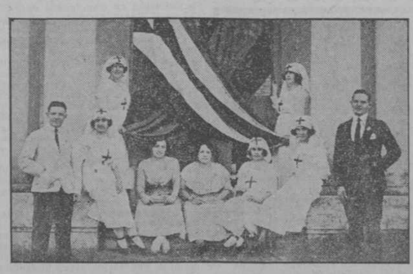
EL "DIA DE ESPAÑA" EN BOLONDRON