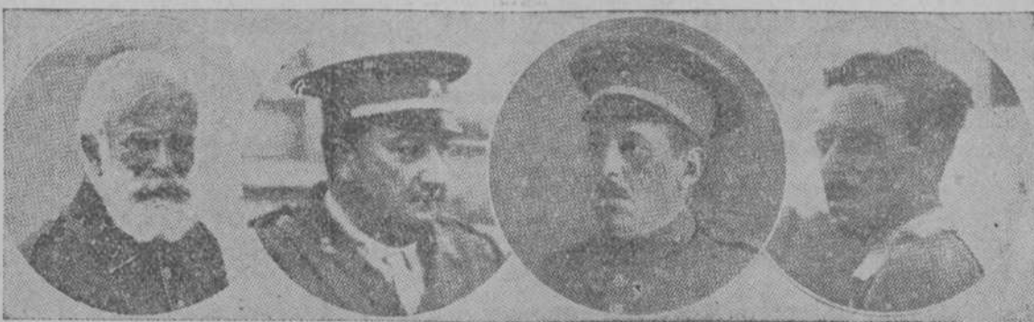
Los Gloriosos Generales Cabanellas, Sanjurjo y Riquelme, y el Teniente Coronel Millán Astray, que están dirigiendo las operaciones de las tropas españolas en el teatro de la guerra del Rif.

SABADO 12. DOMINGO 13. TANDAS DE 4-8 1/2 Exhibición de la sensacional revista de gran actualidad ESPAÑA EN MARRUECOS