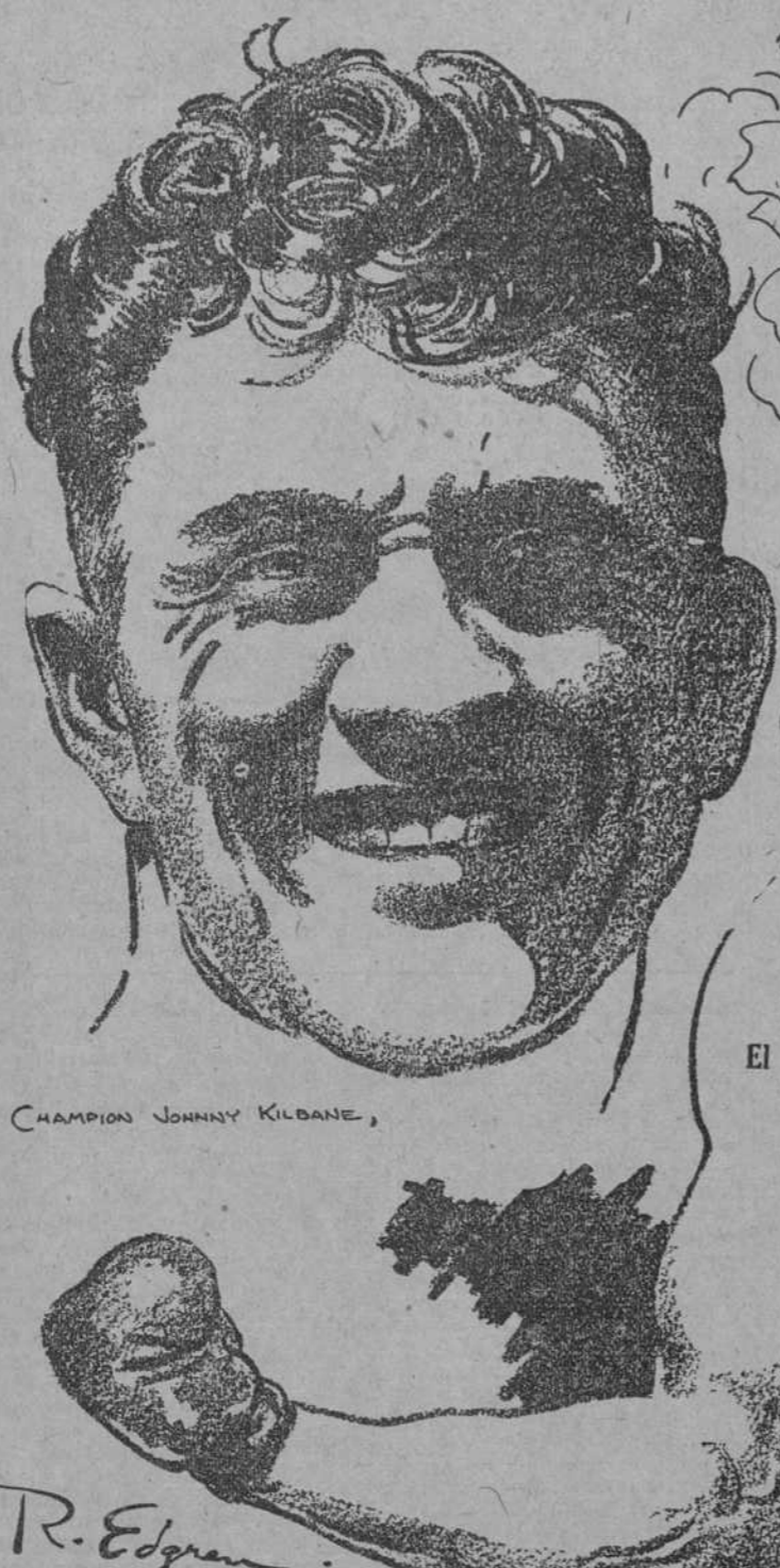
CHAMPION JOHNNY KILBANE,