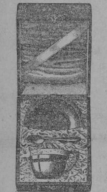
Estuche de niño: Taza, plato y cuchara, lindo regalo.