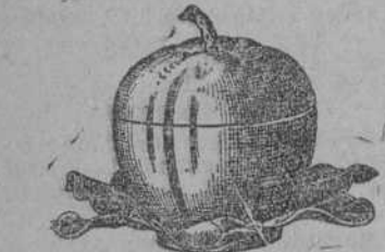
Linda motera, forma manzana.

Siempre tenemos cuanto se pueda desear en artículos de plata alemana, y cristal, todo bellísimo, propio para obsequios. Vea algunos y verá que hay mucho, bueno y barato.