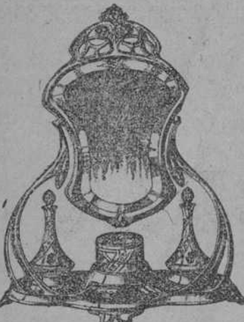
Primoroso juego de tocador, propio para dama. Hoy, 12, es el Pilar. No olviden a las amigas de ese nombre.