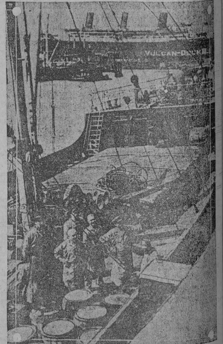
El "Phoenix", cargado de alimentos para las víctimas del hambre en Rusia, se encuentra en la bahía de Hamburgo, pronto a partir, en auxilio de los desdichados creyentes de Lenine y sus Doctrinas.