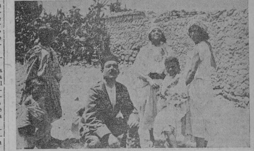
El mismo capitán comprando frutas a unas moras de Ishafen

Internacional", y aunque no tengo el honor de conocerlo, tengo el gusto de acompañarle unos datos por si le resulta VD. oportuno escribir algo sobre lo que expongo más abajo. Los datos a que me refiero son las especificaciones de los seis dreadnoughts que el Gobierno Inglés ha acordado vender en subasta, según publica el "New York Times" en su edición del domingo 21 del actual. Creo que sería de gran conveniencia para España el adquirir tres de estos barcos para reforzar nuestra escuadra. Los tres primeros de la lista, —aparte de ser los más modernos— son prácticamente gemelos, teniendo cada uno 10 cañones de 12" (2 más que los del "España", "Alfonso XIII" y "Jaime I") y podrían formar junto con estos tres que acabo de citar la base de nuestra escuadra de combate, que no debemos dudar en fomentar, para que cuando llegas el momento oportuno no nos suceda como con el ejército en Marruecos, que carecía de lo más elemental. Esta escuadra podría completarse con 4 buenos cruceros de combate