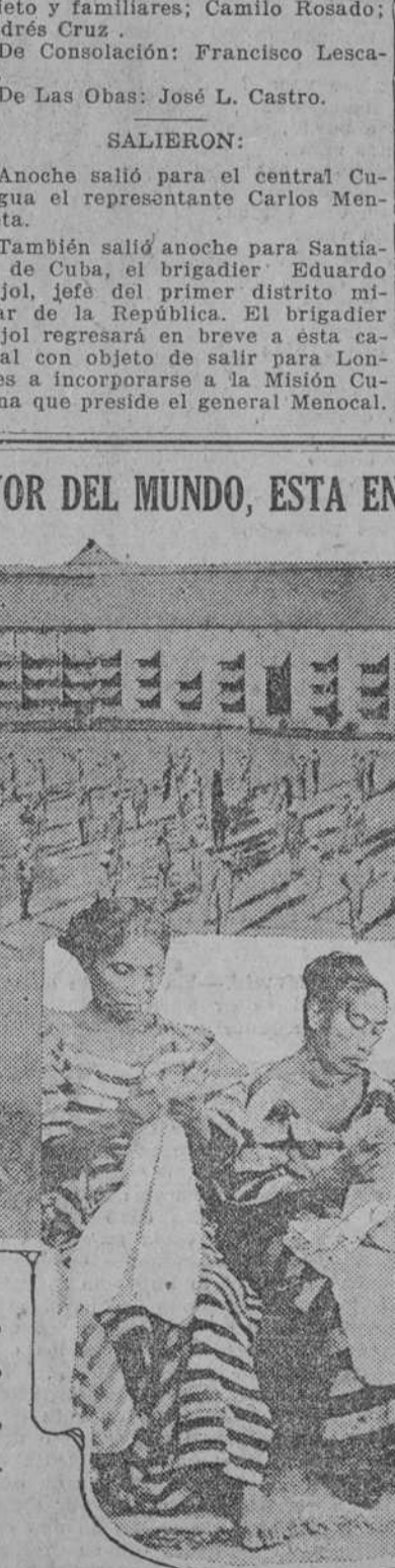
Vista lateral del enorme edificio, en cuyo patio se están ejercitando los inquilinos. También puede verse, algunas prisioneras del sexo femenino, sumidas en su labor diario.