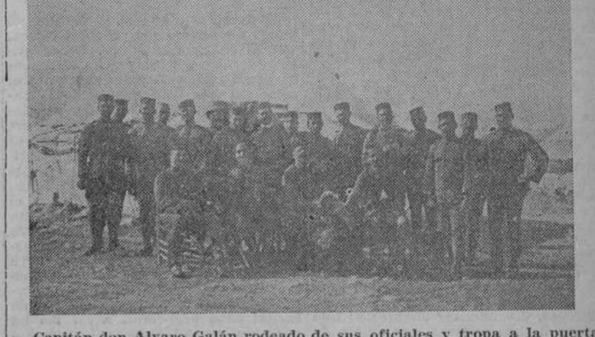
Capitán don Alvaro Galán rodeado de sus oficiales y tropa a la puerta de su tienda en Monte Arruit.

HAY QUE HACER ESCUADRA. Desde hace muchos días tengo en mi poder una carta que quería comentar aunque no pude hacerlo hasta hoy por la multiplicidad de asuntos que sobre mí pesan. La carta dice más por sí misma que cuantas explicaciones pudiera yo dar sobre ella. Está bien escrita y su autor "Uu Español" de carácter incógnito, la documenta con fotografías que no reproducimos porque los clichés saldrían muy borrosos. Es preciso mirar por los institutos armados, pesa cuantas compañías hagan en su contra los eternos opositores de una España grande. Ninguna nación alcanzó a ser potencia de primer orden sin una buena escuadra y si un respetable ejército. A eso tiende mi comunicante, cuya carta dice así: Habana, Agosto 29 de 1921. Sr. Joaquín Gil del Real. DIARIO DE LA MARINA, Ciudad. Muy Sr. mfo: Soy asiduo lector y muy entusiasmado de su admirable sección "Gaceta