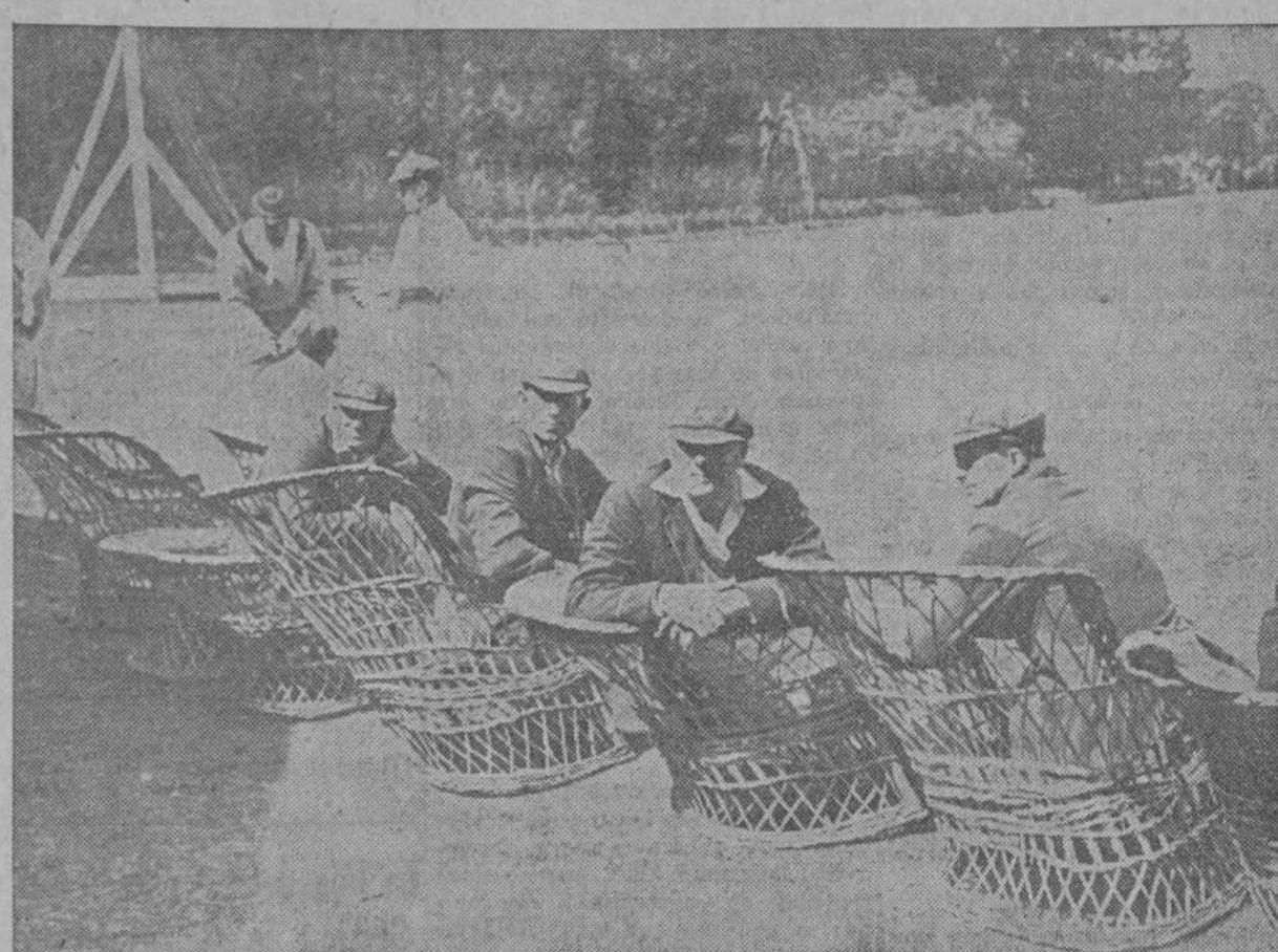
Pintoresca escena de los jugadores de un team inglés de cricket, esperando su turno de ir al bate. Como se sabe los juegos de "cricket" duran varios días y los jugadores tienen tiempo de tomar té mientras se desarrolla un emocionante desafío. Incidentalmente debe decirse que son muchos los que creen que la idea matriz del base ball halláase en el cricket.

El martes lucharán en el teatro Payret, el Español Incógnito con el japonés Satake.