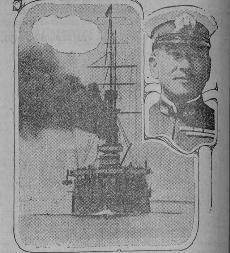
El Crucero Yakumo, entrando en la bahía de San Diego, donde permanecerá seis días. Después, en compañía del Izumo, continuará su vuelta al mundo, vía Canal de Panamá, Nueva York, Liverpool, Havre y retornó al lejano Oriente. El Comandante de la Expedición, Almirante Saito, puede verse arriba.