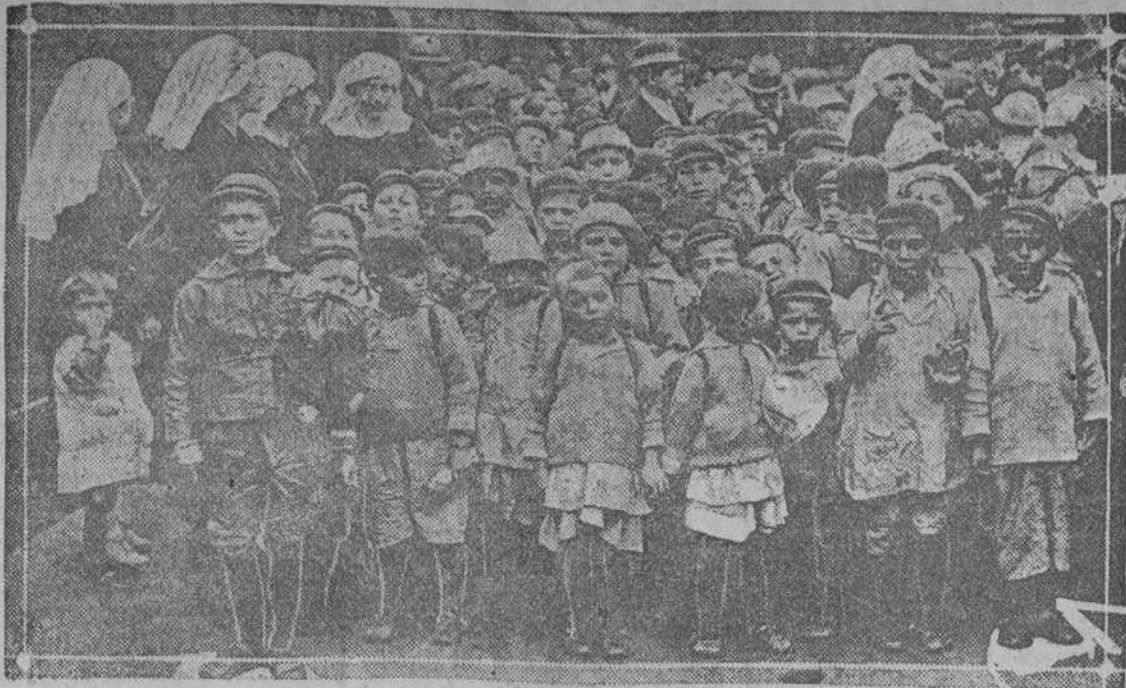
Estos pequeños rusos, llegan a Inglaterra con destino al Africa del Sur, huyendo de la Miseria y Desesperación en que ha sumido Lenin y Trotzky a Rusia.