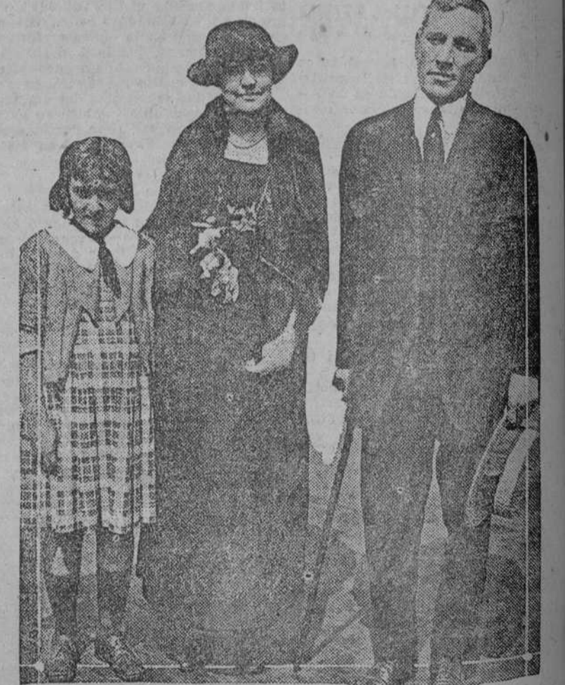
El Coronel William Haskell, con su esposa y única hija, desembarcan en Riga, para dirigirse al interior del desgraciado Imperio Moscú, donde reina la desesperación más tremenda.