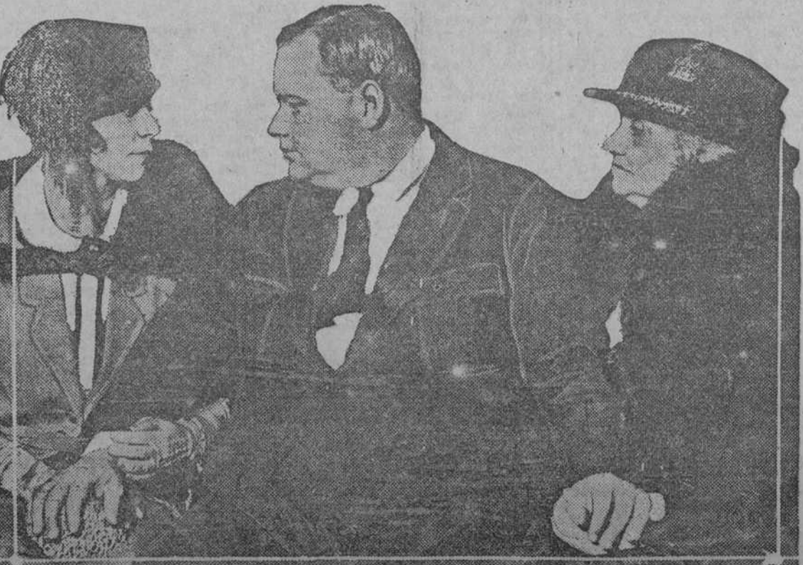
Fatty Arbuckle, recientemente acusado de asesinato de Virginia Rappe, en estos momentos está tranquilo; confiado en la defensa que le hará su suegra. Además su esposa, de la cual estaba distanciada, ha corrido a su lado, perdonando todo lo pasado, y sólo viendo el peligro presente que corre su amado Gordito.