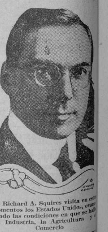
Sir Richard A. Squires visita en estos momentos los Estados Unidos, examinando las condiciones en que se halla la Industria, la Agricultura y el Comercio

Los "Jóvenes Católicos" saben que muchos pobres de espíritu se ocultan de confesar que son religiosos porque no poseen suficiente valor para soportar las burlas de sus compañeros de fábrica o de taller o de mostrador; saben que se pierden otros por no atreverse a decir "no" cuando se les invita a tomar parte en actos vergonzosos, pues de no aceptar ellos lo que les repugna en muchos casos se comportan infamantes epítetos y motes que acaso perdurasen por los días de su vida.