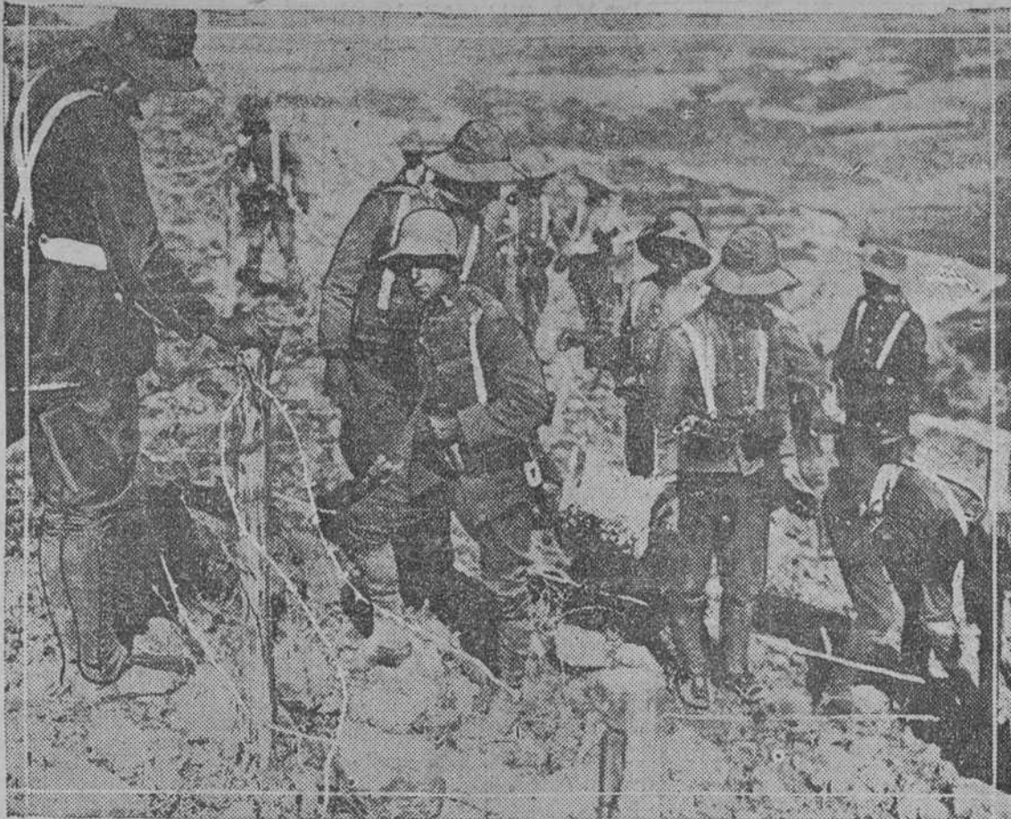
Las tropas del Rey Alfonso tienden alambradas en los alrededores de la ciudad para estorbar el avance de los parciales de Abd el Krim