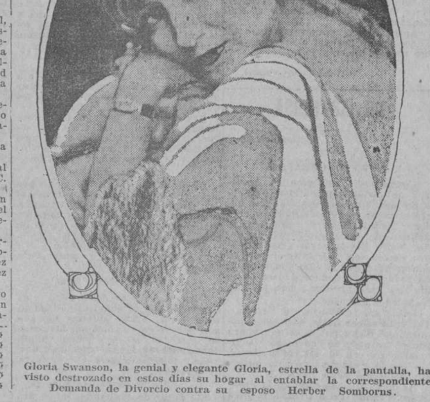
Gloria Swanson, la genial y elegante Gloria, estrella de la pantalla, ha visto destruido en estos días su hogar al entablar la correspondiente Demanda de Divorcio...