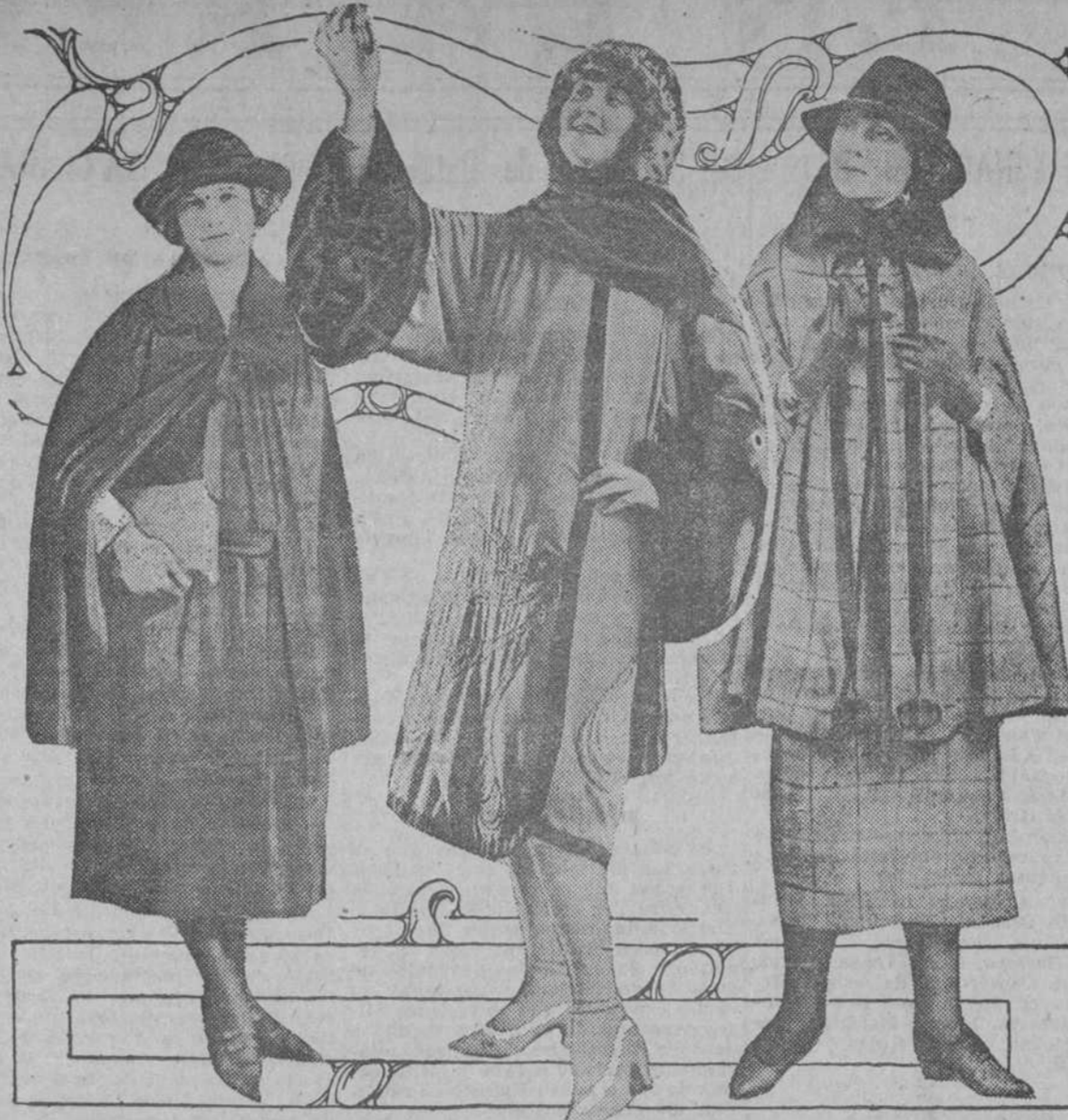
En Octubre abren sus puertas de nuevo todos los Colegios e Instituciones Educativas de la Unión Americana y traídas de esta manera aparecerán las alumnas...