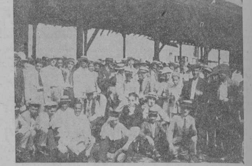
Grupo de legionarios que ayer embarcaron en el vapor "Antonio López con objeto de ir a pelear en Marruecos.