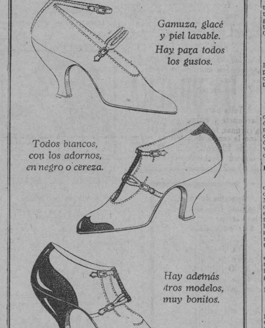
Gamuza, glacé y piel lavable. Hay para todos los gustos.