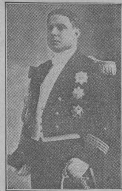
El nuevo Jefe del Estado Mayor de la Marina de guerra