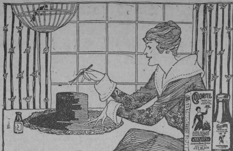
El Sombrero del año pasado aparece tan bueno como nuevo con el uso de Colorite

En las columnas de este mismo periódico hemos dicho hace algunos