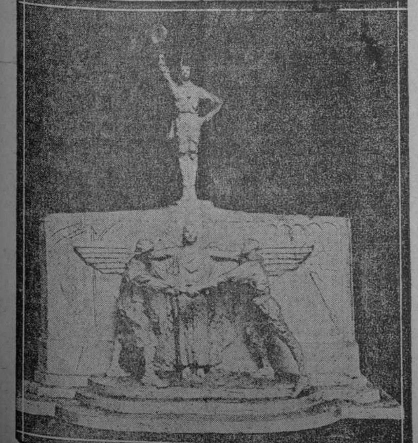
EL VOLUNTARIO AMERICANO—Este es el nombre que se dará a una estatua, obra del famoso escultor francés Jean Boucher, la que será colocada en uno de los lugares céntricos de París.