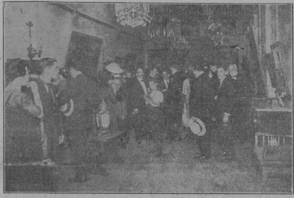
UN ASPECTO DE LA EXPOSICION PINAZO EN EL ACTO INAUGURAL

El gran triunfo de este excelso pintor inquieto, señala la aurora de nuestro futuro ambiente artístico