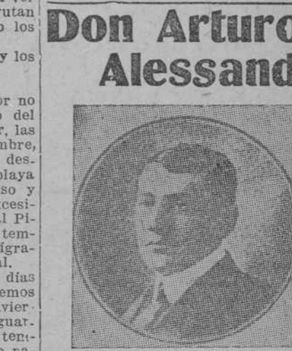
Presidente electo de Chile