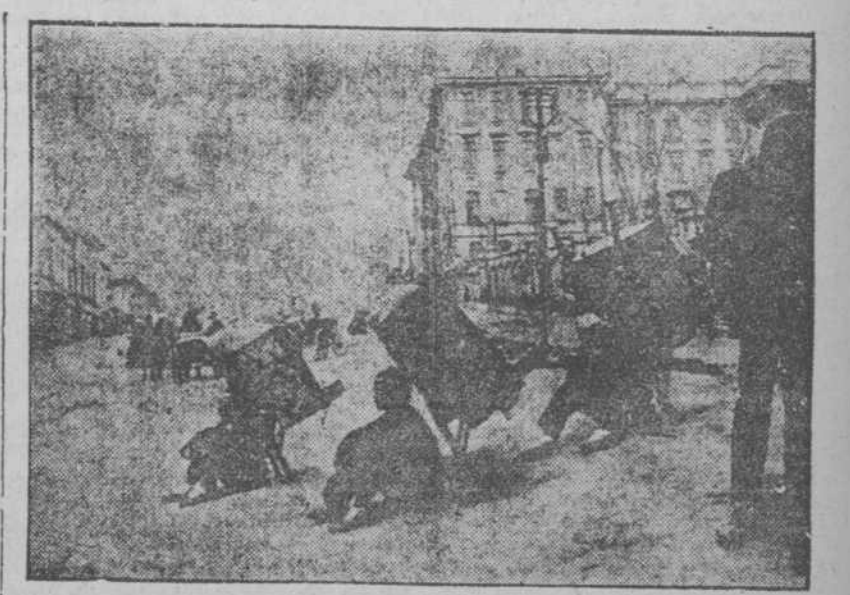
Las mudadas en China son más fáciles y económicas contratando culies para el transporte de los muebles.

Aunque en las operaciones del año anterior por el Gobierno se consignó un superávit de $231,221,547, el cambio más importante, dicen los funcionarios del tesoro, fué la inclusión de $1,185,184,692 en el total de la deuda pública, durante el año fiscal. La deuda nacional, ascendió a $24,299,321,467 en 30