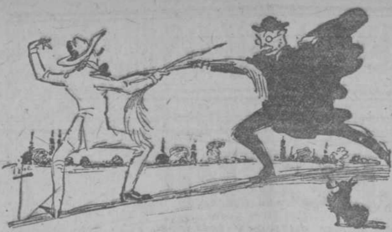
Habana, Marzo 5, 1920. Señores Solís, Entrialgo y Cia. "El Encanto". Ciudad.

Por Laureano Ramón Medina. 2.—Tannhäuser (romanza) de Wagner. Por Néstor de la Torre. 3.—Pagliacé (arioso) de Leoncavallo. Por el tenor Medina. 4.—Il Re di Lahore (arioso) de Mascagni. Por el barítono de la Torre. 5.—Bohème (duo) de Puccini. Por los dos cantantes. Acompañados serán al piano todas las piezas de canto que anteceden por el maestro Beniloch. La revista Sevilla de mis amores , que desde hace algún tiempo no sube al cartel, pondrá término a la interesante función. Desde el día de ayer que se puso a la venta las localidades en la Contaduría de Martí empezaron los pedidos de palcos. Se venderán todos esa noche. Con seguridad.