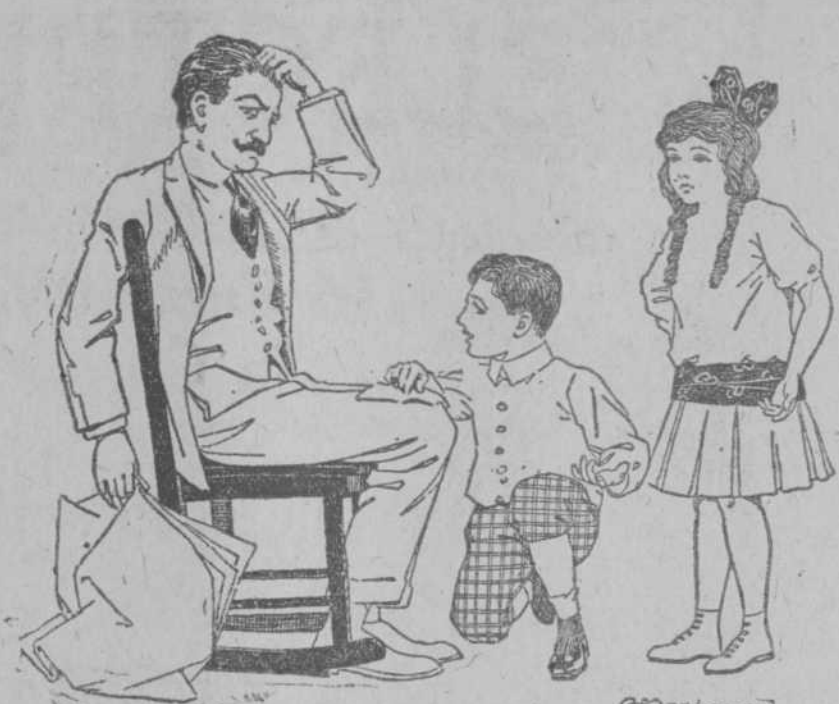
Plan de la Obra

Después, mirándome de nuevo, exclamé: —Y eres tú el Juan Noel a quien tantas veces quisiera escribir... ¿Verdad, verdad? Nunca he experimentado mayor sorpresa.