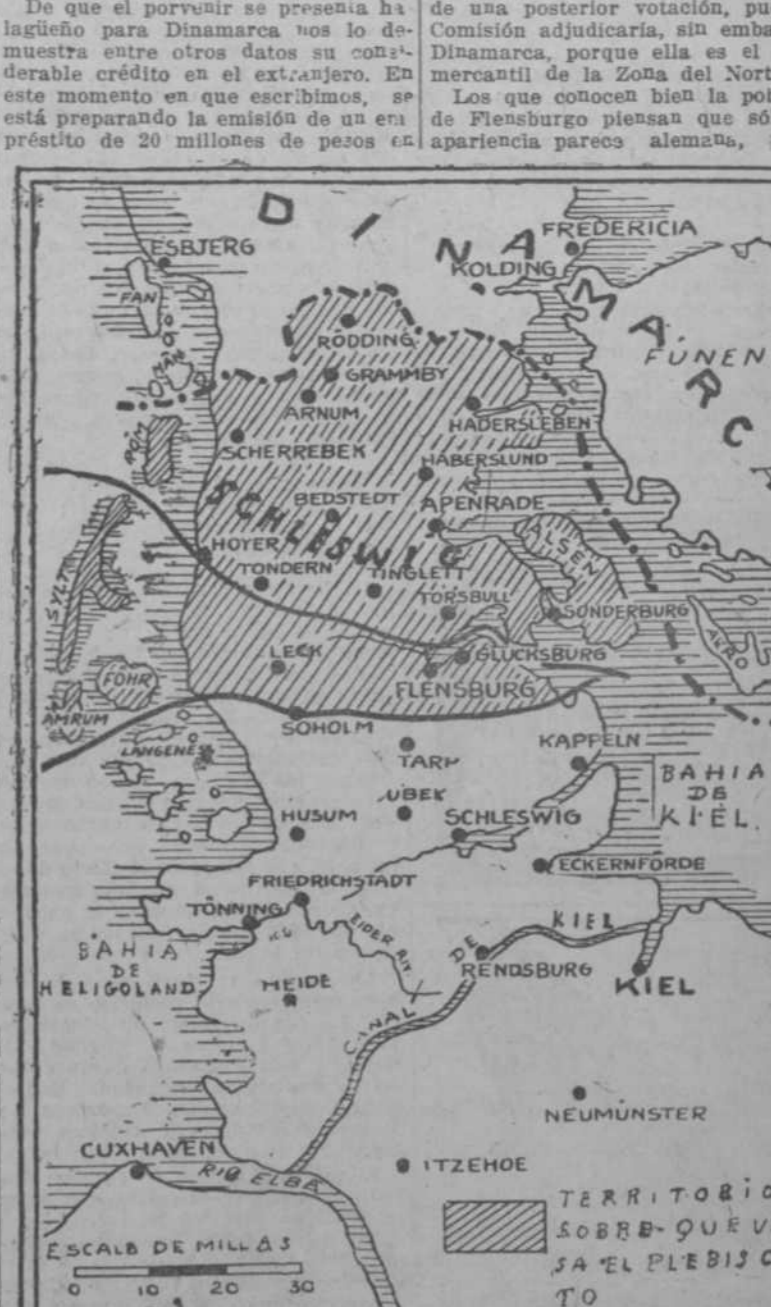
Mapa parcial de Dinamarca en el que aparecen sombreadas las dos secciones de Schleswig, Norte y Sur, separadas por una línea curva transversal que va de Glücksburg a Hoyer. De este a Oeste, objeto del plebiscito pactado en el Tratado de Versalles.