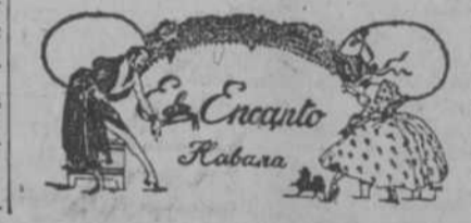
C1345 1d-5 1t-5