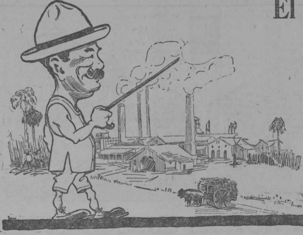
Este dibujo está exagerado. El placer que da usar B. V. D. no lo es

La Calidad B. V. D. es Solamente Obtenible en la Ropa Interior B. V. D.